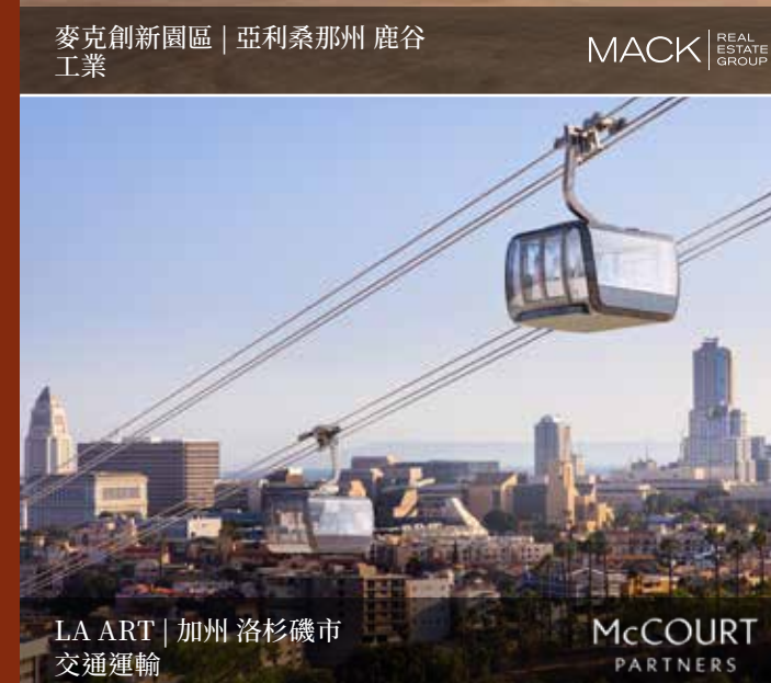
LA ART | 加州 洛杉磯市 交通運輸