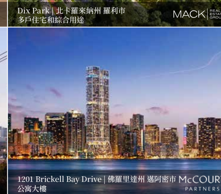
1201 Brickell Bay Drive | 佛羅里達州 邁阿密市 公寓大樓