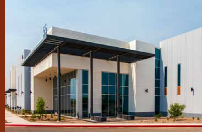
麥克創新園區 | 亞利桑那州 鹿谷 工業