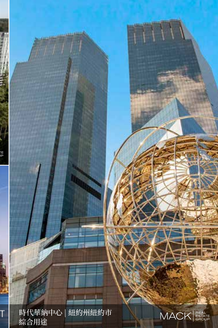
時代華納中心 | 紐約州紐約市 綜合用途