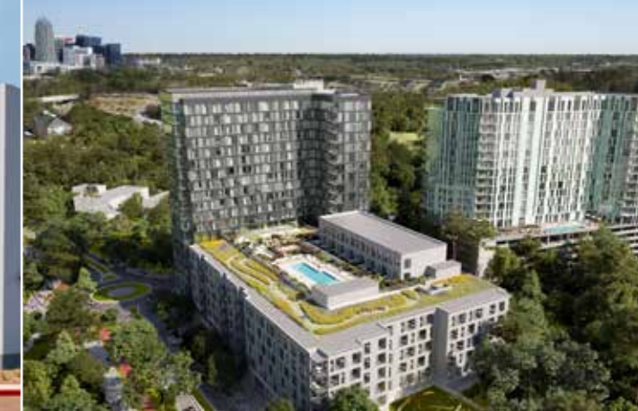
Dix Park | 北卡羅來納州 羅利市 多戶住宅和綜合用途