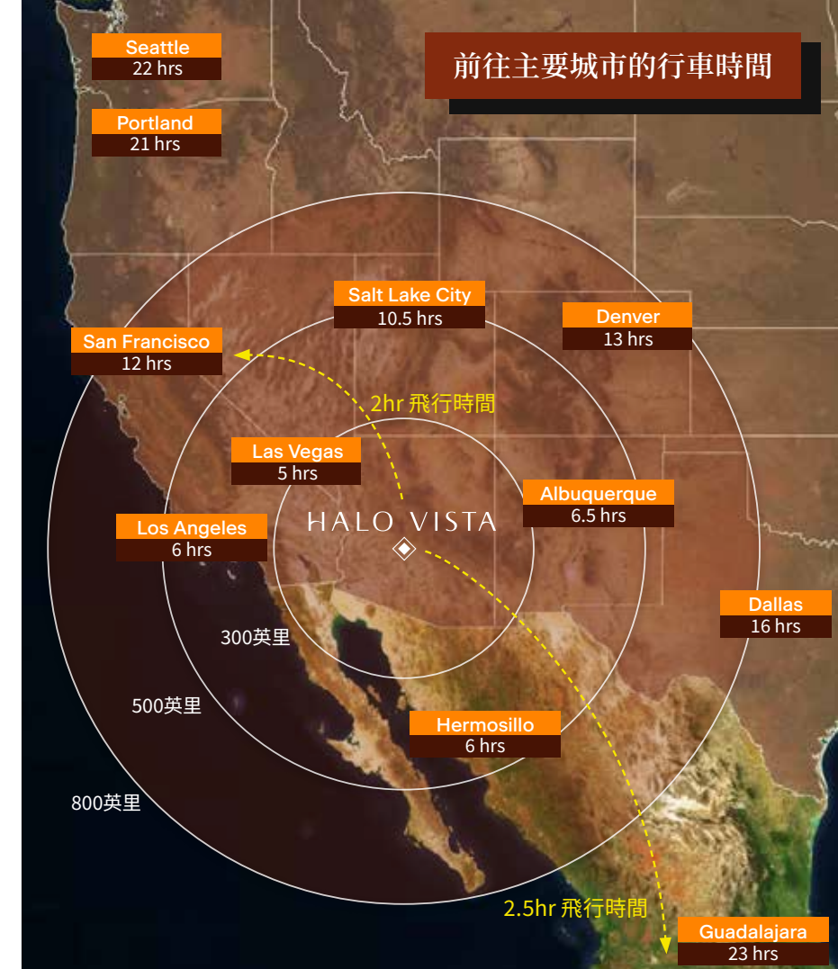
前往主要城市的行車時間