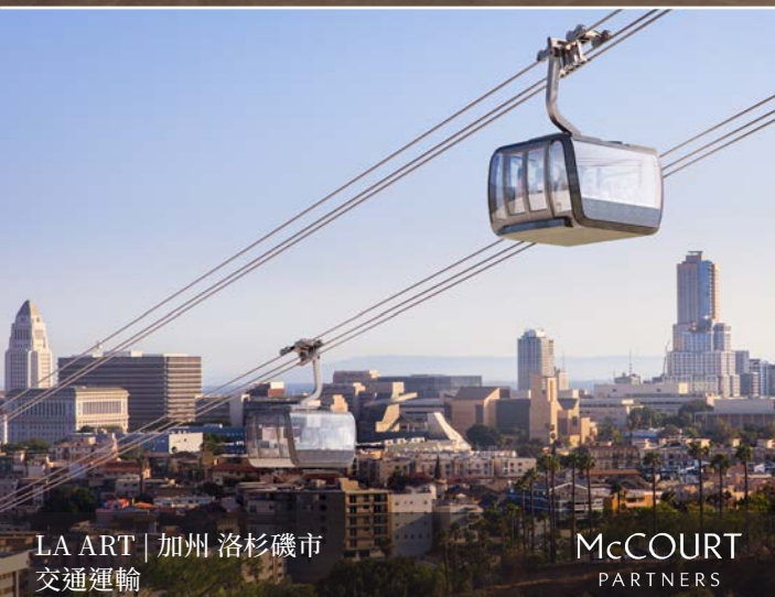
LA ART | 加州 洛杉磯市 交通運輸