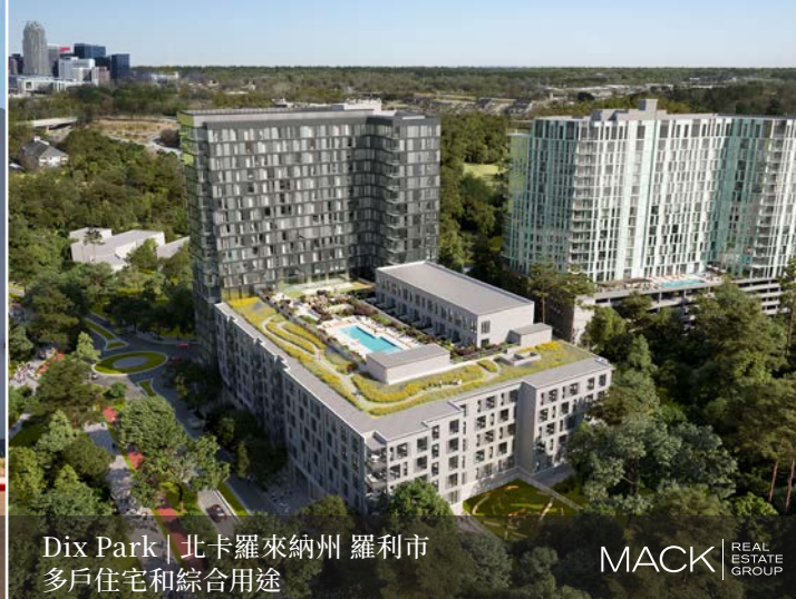
Dix Park | 北卡羅來納州 羅利市 多戶住宅和綜合用途