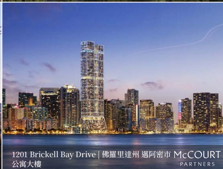
1201 Brickell Bay Drive | 佛羅里達州 邁阿密市 公寓大樓