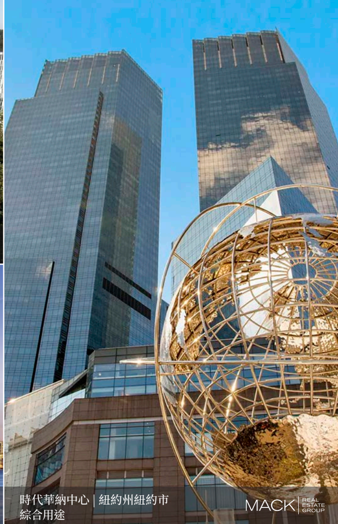
時代華納中心 | 紐約州紐約市 綜合用途