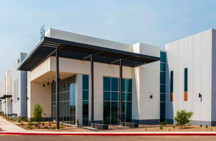
麥克創新園區 | 亞利桑那州 鹿谷 工業